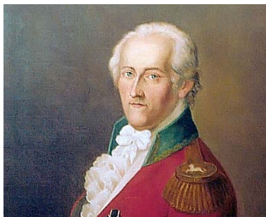
Freiherr Adolph Franz Friedrich Ludwig Knigge.

A dolph Freiherr von Knigge war der Spross einer uradligen, allerdings verarmten Familie. 1788 erschien die erste Ausgabe seines wohl bekanntesten Werkes „Über den Umgang mit Menschen“ (heute einfach kurz als „Knigge“ bekannt). Knigge beabsichtigte damit eine Aufklärungsschrift für Taktgefühl und Höflichkeit im Umgang mit den Generationen, Berufen, Ständen und Charakteren, die einem auch Enttäuschungen ersparen sollte.